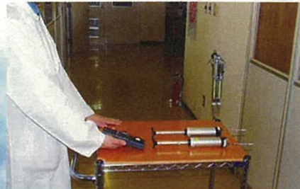
室内空気環境測定