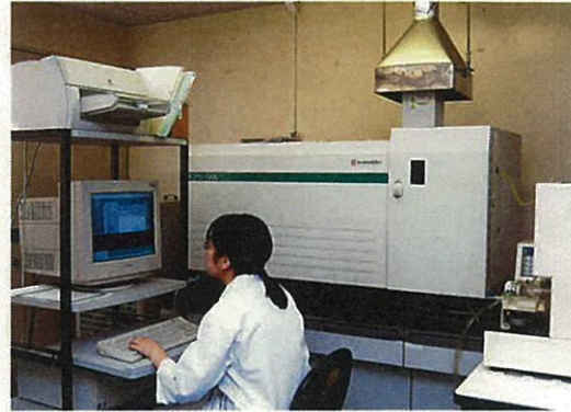
誘導結合プラズマ発光分光分析計