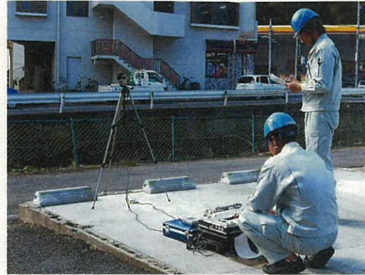
騒音・振動測定状況