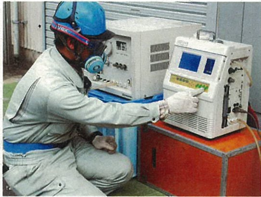
CO、O 2 の連続測定(ダイオキシン類)