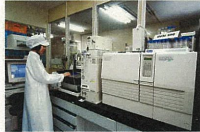
バージ・トラップ・ガスクロマトグラフ質量分析計