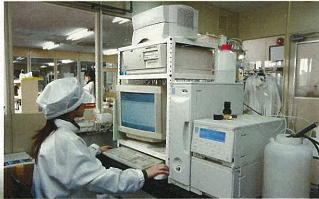
微量物質分析(クロマトグラフ)