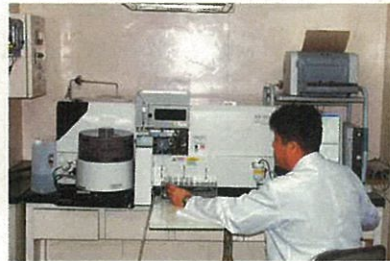
原子吸光度計(有害金属分析)