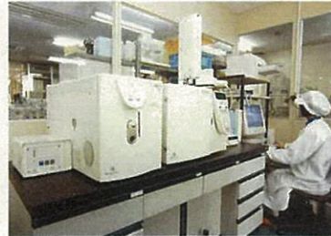
ガスクロマトグラフ質量分析計