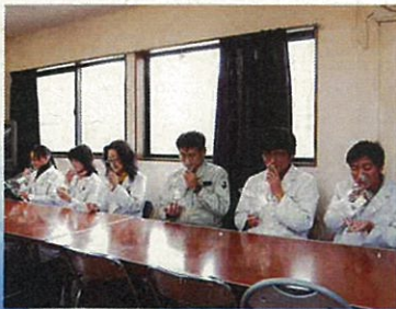
臭気強度(官能試験)