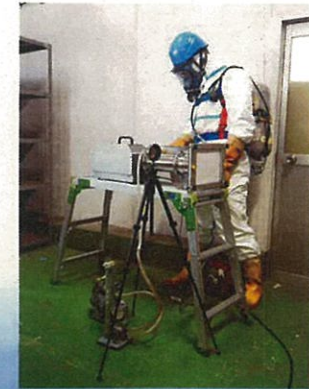
作業環境測定(ダイオキシン類)