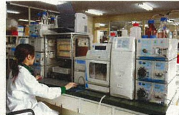
イオンクロマトグラフ・ポストカラム分析計