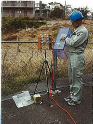
悪臭物質の採取(敷地境界)