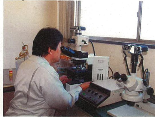
アスベスト顕微鏡観察