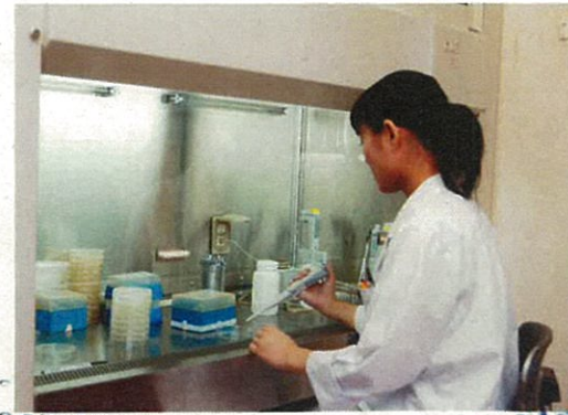
レジオネラ菌検査