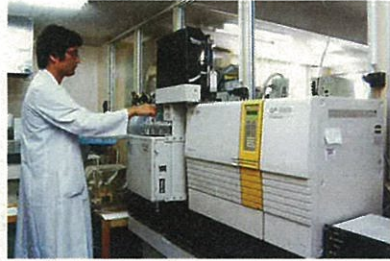
ガスクロマトグラフ質量分析計(農業分析)