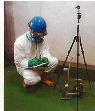
空気中のアスベスト濃度測定