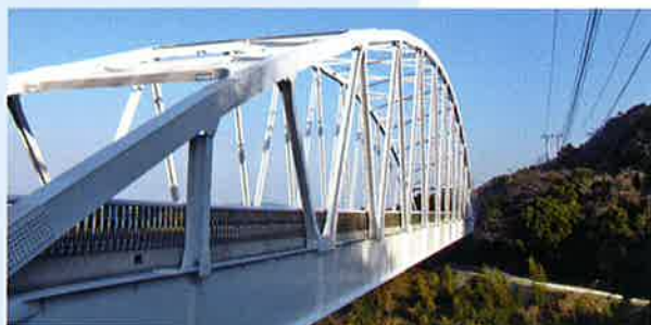
【荒川大橋】 ■受注先 長崎振興局 ■工事名 荒川橋 橋梁塗装工事 ■竣工 平成24年3月