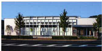
■受注先 株式会社 親和銀行 ■工事名 親和銀行日野支店 新築工事 ■竣工 平成 21 年 7 月