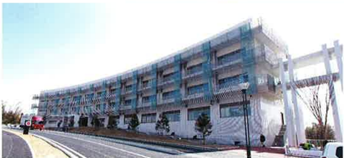
■受注先 国立大学法人 九州大学 ■工事名 九大(伊都)共進化社会システムイノベーションセンター 新営その他工事 ■竣工 平成 27 年 2 月