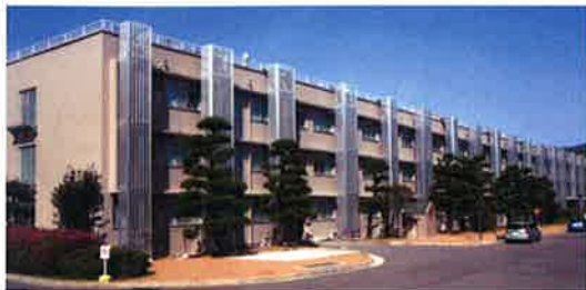
■受注先 国立大学法人 長崎大学 ▲工事名 総合研究棟(水産学部本部)耐震改修工事(全面リニューアル) 竣工 平成 20 年 3 月 ▶工事名 学生支援・教育施設新営工事 竣工 平成 24 年 8 月