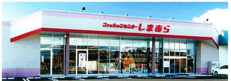
■受注先 株式会社 しまむら ■工事名 ファッションセンター しまむら ひびきの店 ■竣工 平成20年12月