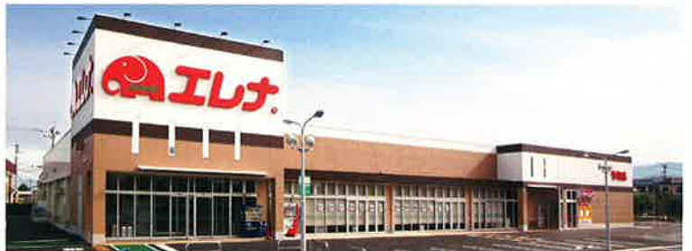
■受注先 株式会社 エレナ ■工事名 エレナ竹松店 新築工事 ■竣工 平成26年5月