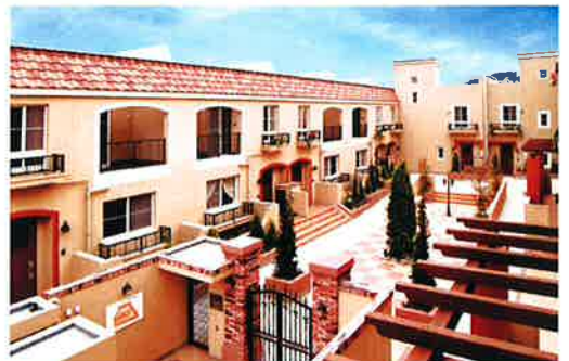
■受注先 トーエイ興産 株式会社 ■工事名 ティーズタウン大黒 新築工事 ■竣工 平成17年12月