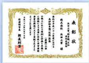
佐世保市 高砂駐車場新築工事