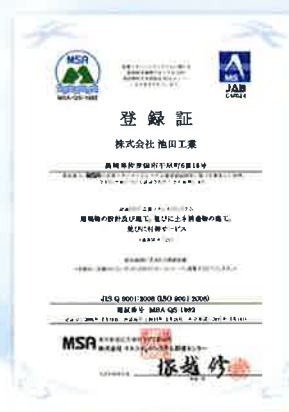
ISO 9001:2008 登録証 (承認番号 MSA-QS-1692)

ISO(国際標準化機構)を取得し、国際規格を自らに課すことにより設計・施工技術で皆様からの厚い信頼を得られることを目指しております。