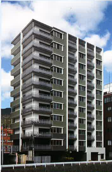
■工事名 リバーサイドパーク 元町新築工事 ■竣工 平成24年1月

豊富な建築実績から生み出される創造性 オリジナリティ溢れる設計・施工の企画型マンション