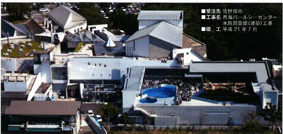
■受注先 佐世保市 ■工事名 西海ホールシーセンター 水族館整備(建築)工事 ■竣工 平成 21 年 7 月