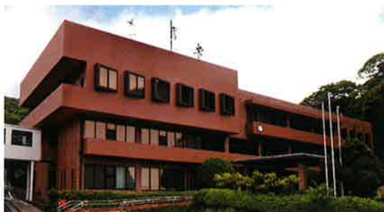
■受注先 西海市 ■工事名 西海市役所本庁舎 耐震・外壁 改修工事 ■竣工 平成 23 年 4 月