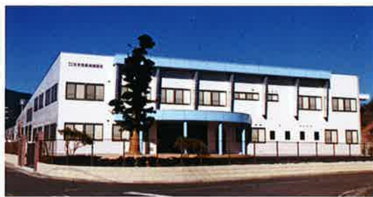
■受注先 株式会社 佐世保航海測器社 ■工事名 佐世保航海測器社 社屋新築工事 ■竣工 平成 14 年 12 月