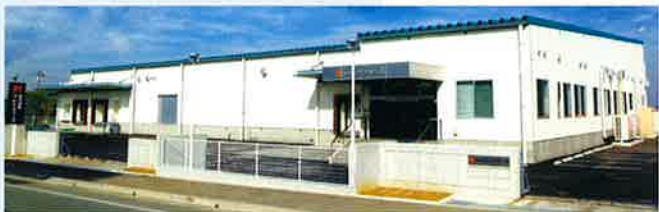
■受注先 株式会社 プレナスフーズ ■工事名 プレナスフーズ 広川新工場新築工事 ■竣工 平成20年10月