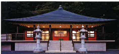
■受注先 株式会社 大林組 ■工事名 御橋観音寺新築工事 ■竣工 平成 16 年 11 月