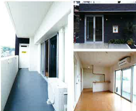
[1LDK: 14戸 2LDK: 7戸]