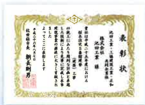
佐世保市 市宮桜木住宅5番館建替工事