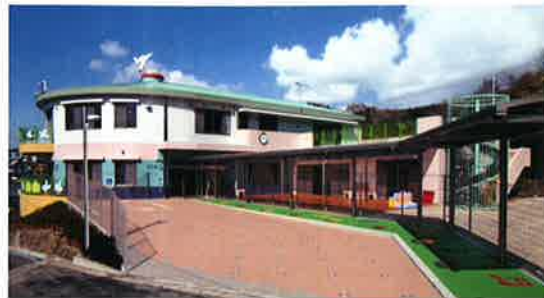
■受注先 社会福祉法人 日昇会 ■工事名 ぼっぼ保育園 新築工事 ■竣工 平成 23 年 3 月