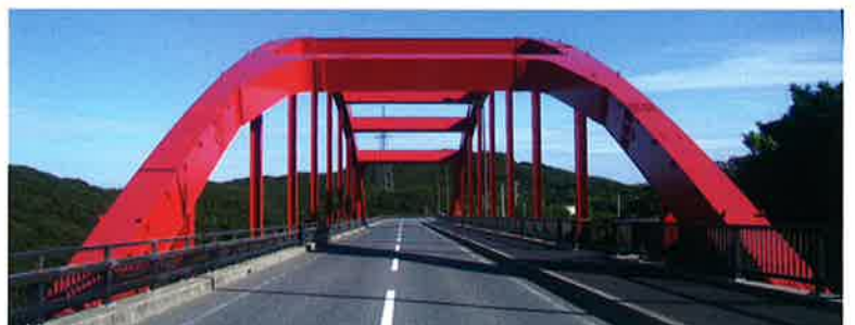
【万閑橋】 ■受注先 対馬振興局 ■工事名 万閑橋 橋梁塗装工事 ■竣工 平成22年7月