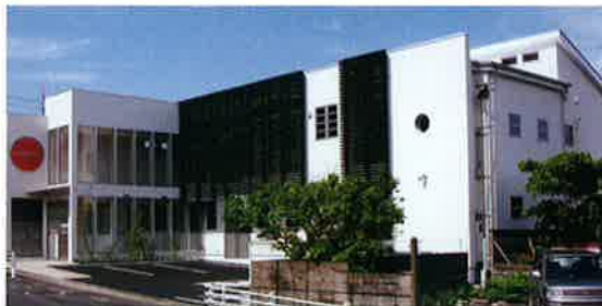
■工事名 大森歯科新築工事 ■竣工 平成16年6月