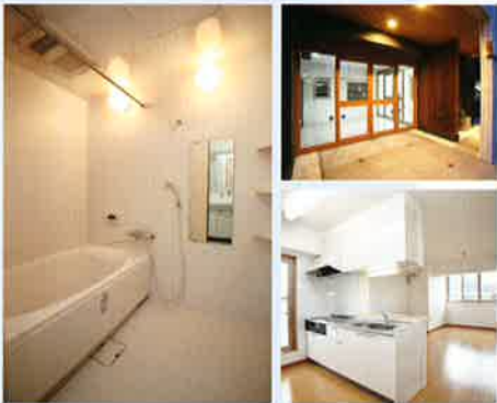
[2LDK: 18戸 3LDK: 10戸 4LDK: 1戸]