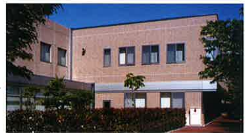
■受注先 佐世保市 ■工事名 市立総合病院心臓血管外科 手術室棟増築工事 ■竣工 平成16年5月