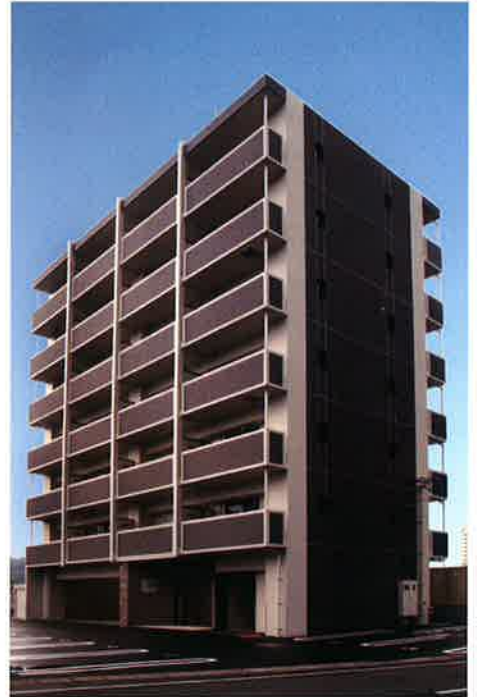
■工事名 崎岡マンション 新築工事 ■竣工 平成25年7月