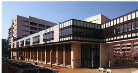
■受注先 佐世保市 ■工事名 高砂駐車場 新築(建築)工事 ■竣工 平成 23 年 8 月