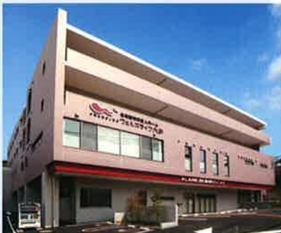
■受注先 株式会社 ウェルズライフ ■工事名 住宅型優良老人ホーム ウェルズライフ大手 新築工事 ■竣工 平成25年7月