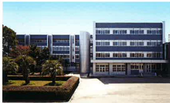
■受注先 独立行政法人 国立高等専門学校機構 ■工事名 熊本電波工業高等学校校舎棟 耐震改修工事(全面リニューアル) ■竣工 平成 22 年 2 月