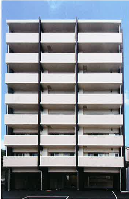
■工事名 御船マンション 新築工事 ■竣工 平成25年5月