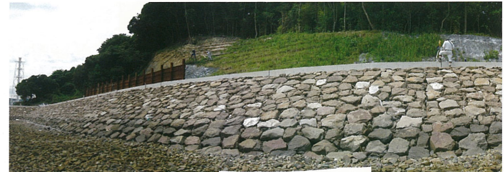
海岸(護岸工)及び緑化工