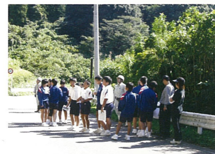
小中学校児童の環境防災教育

小中学校の総合学習協力、NPOとの共同市民参加型イベントとおした環境防災教育で地域に貢献します。