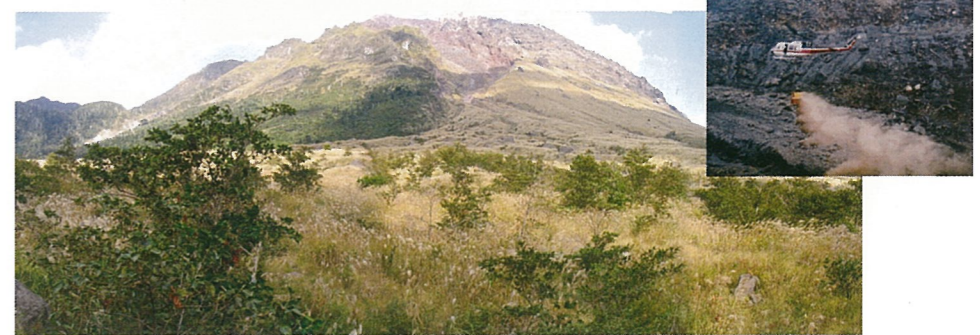
火山地域(雲仙普賢岳)での緑地復旧工(航空実播工)