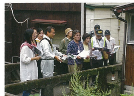
市民参加型環境防災